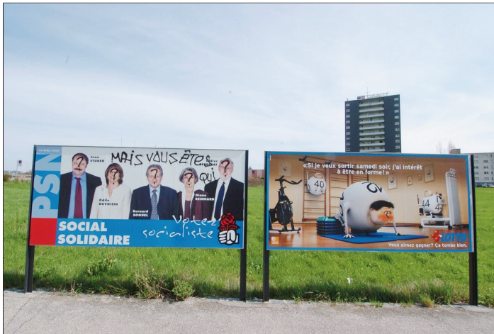
PROPAGANDE Parfois, le message politique des partis suscite le questionnement. «Mais vous êtes qui?», demande un inconnu sur cette affiche du Parti socialiste posée à Marin en 2005.